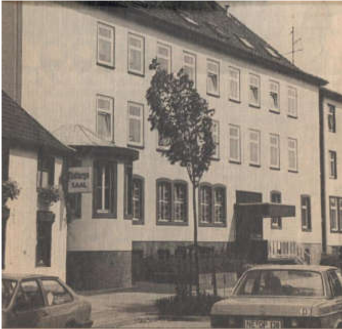
Notburgahaus um 1980