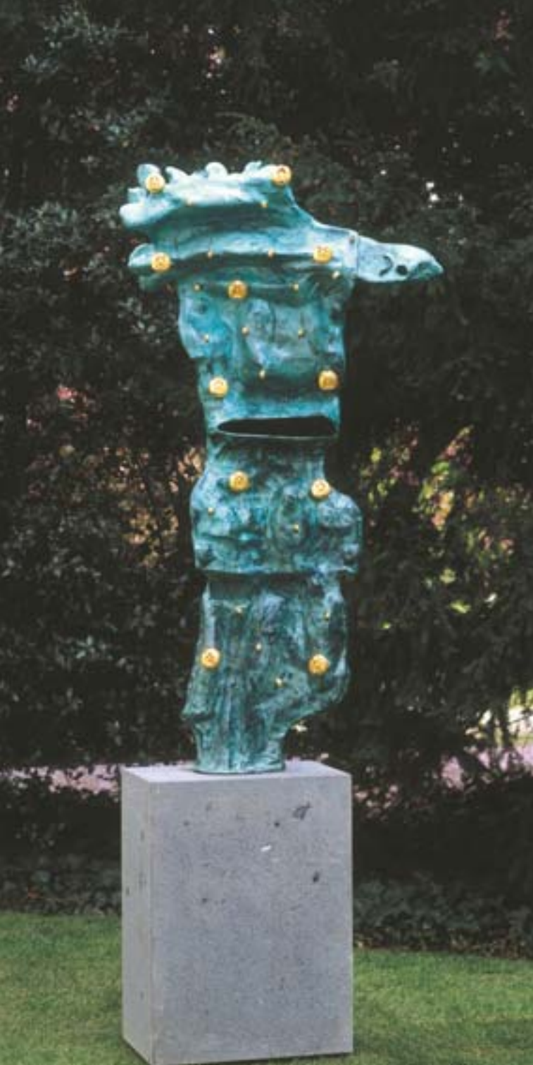
Roberto Sebastian Matta Echaurren, Chaosmos, 1970/2001-02