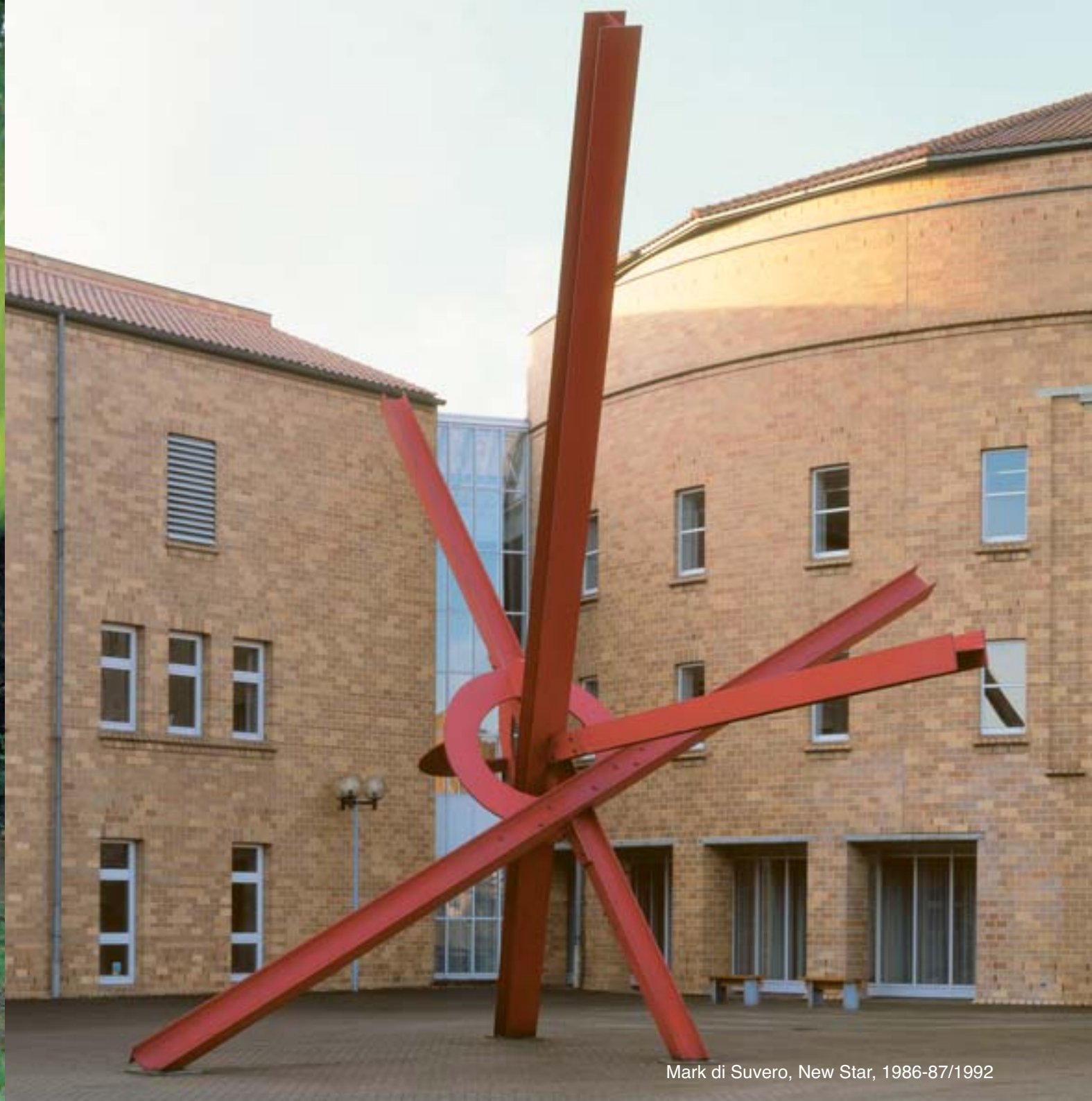
Mark di Suvero, New Star, 1986-87/1992