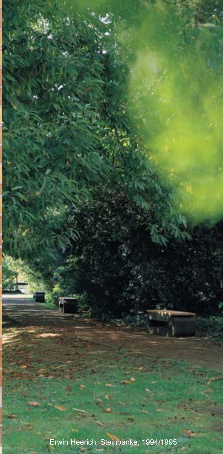
Erwin Heerich, Steinbänke, 1994/1995