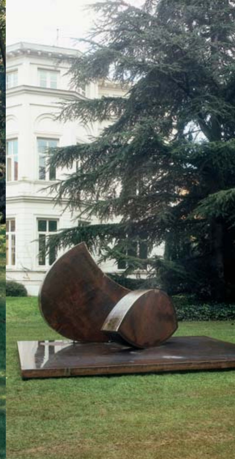
Wolfgang Nestler, Position im Schwerpunkt, 1998