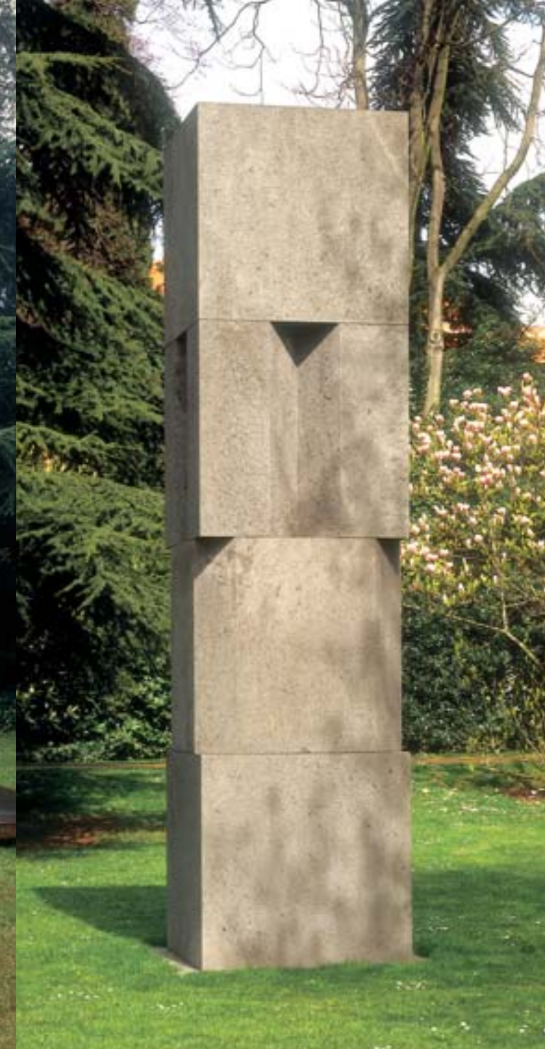
Erwin Heerich, Monument, 1989