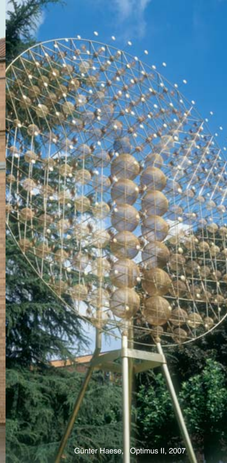
Günter Haese, Optimus II, 2007