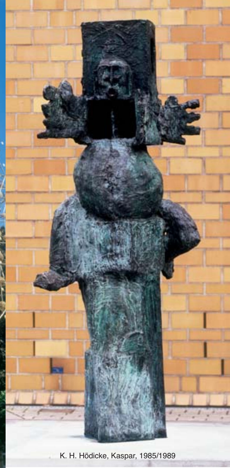
K. H. Hödicke, Kaspar, 1985/1989