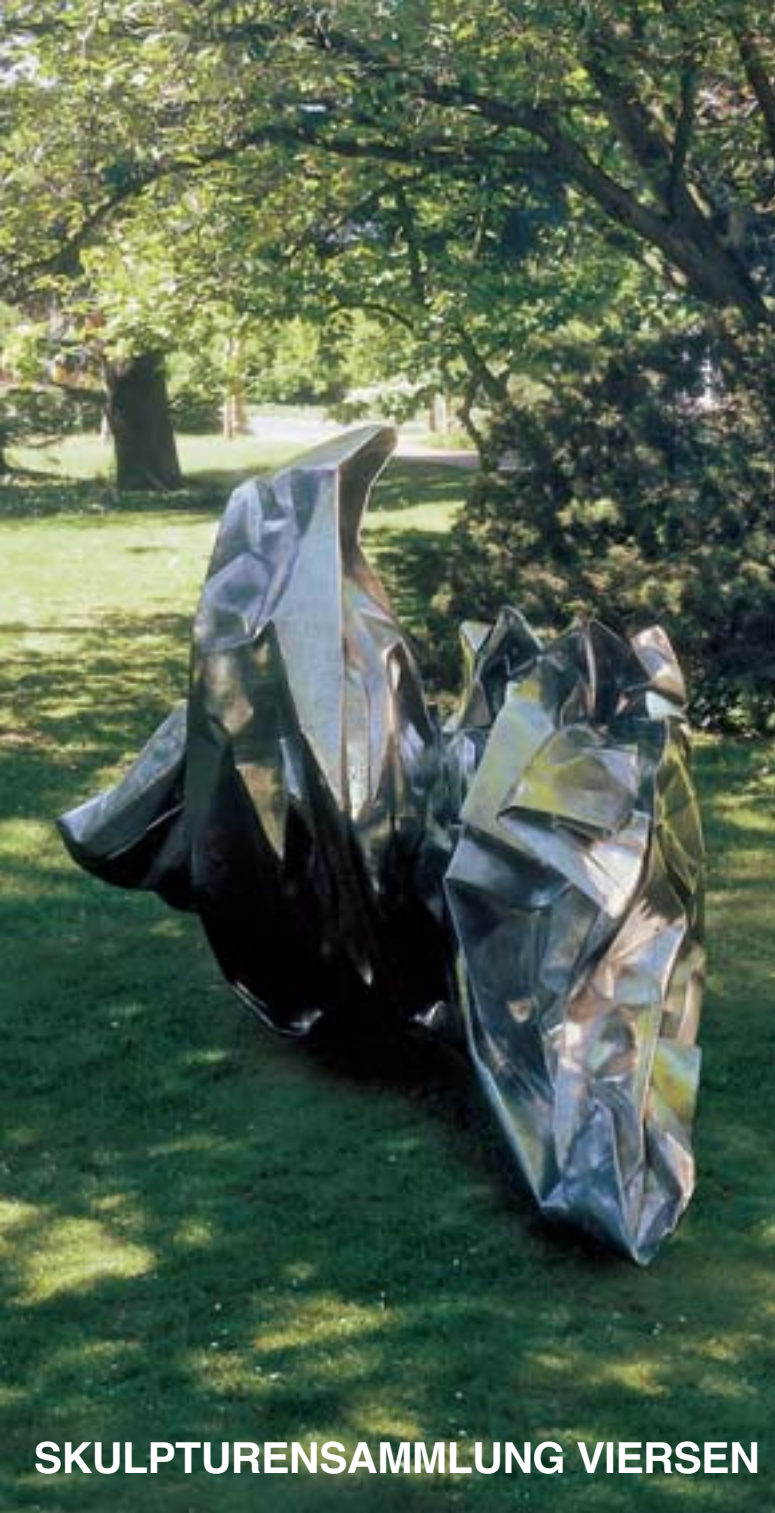
Wang Du, China Daily, 2007/2010